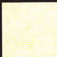
Halcon 30 x 30