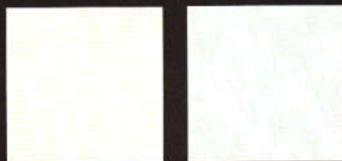
Virgo 30 x 30