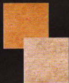
Track 20 x 20