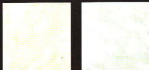
Morgan 30 X 30