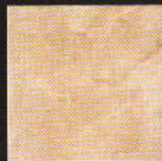
Carlos 30 x 30